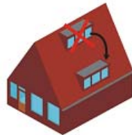
(B) Zadeldak met kap van meer dan 4 meter