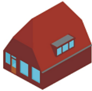
(A) Zadeldak met wolfseind